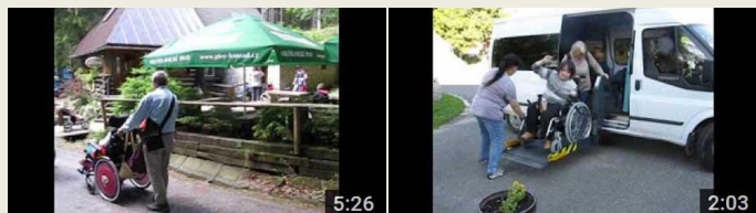
Video Harrachov bez bariér 2016

PŘÍLOHA Infolisty Zrnka 2016 / č.2 / str.1. článek