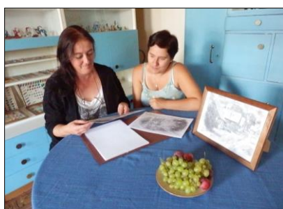
Foto + více v textu zde.. Vánoční besídka 15.12.2016

Naposledy v roce 2016 jsme se 15.12. sešli a v předvánočním čas jsme si společně popovídali, co asi budeme mít pod stromečkem a co nás bude čekat v roce 2017.