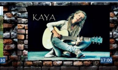
Koncert u zelené dřevěnky pořádá Semínko země, z.s. za podpory Města Semily

PŘÍLOHA Infolisty Zrnka 2016 / č.3 / str.5. článek