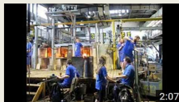
Video Sklárna Novosad a syn